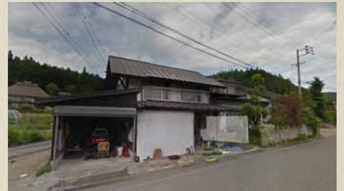
震災前画像