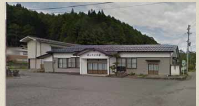
震災前画像 Googleストリートビューより抜粋