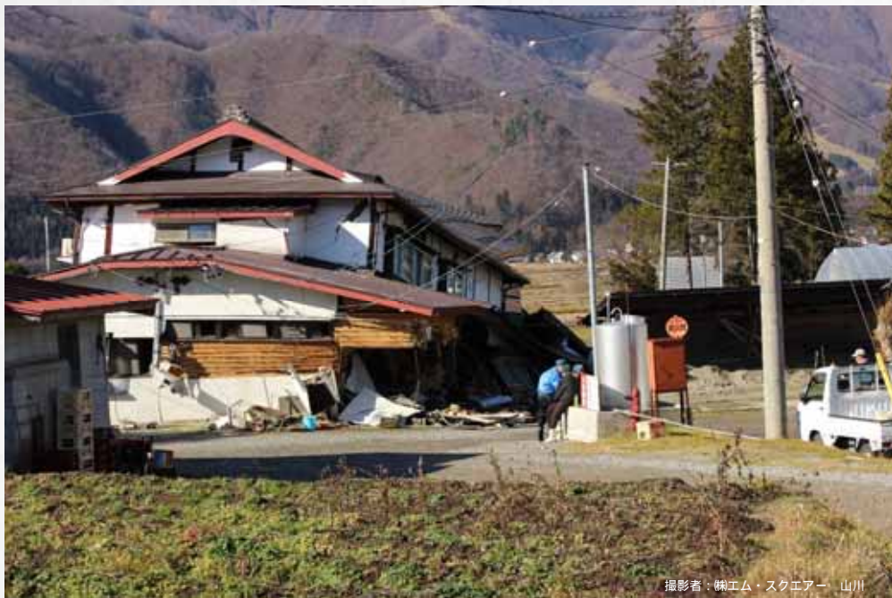
撮影者：韓エム・スクエア、山川