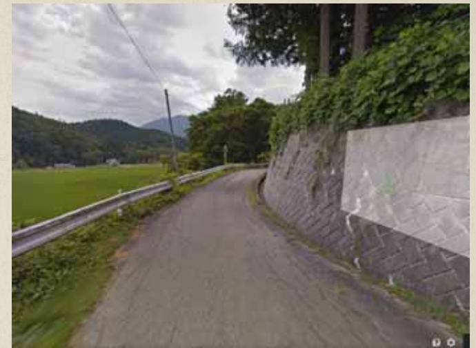
震災前画像