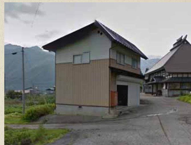
震災前画像