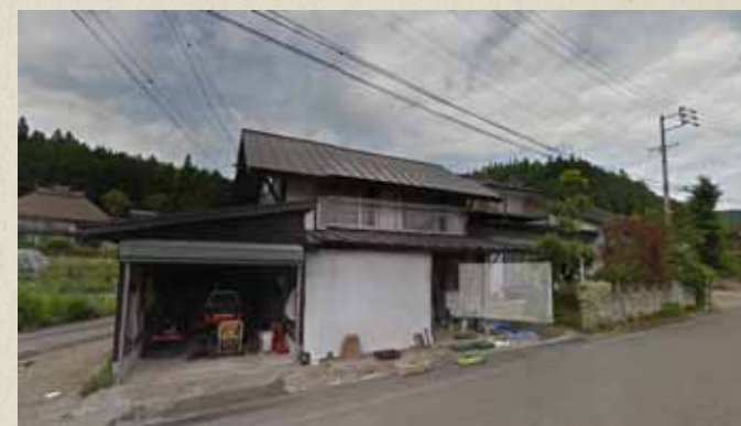
震災前画像 Googleストリートビューより抜粋