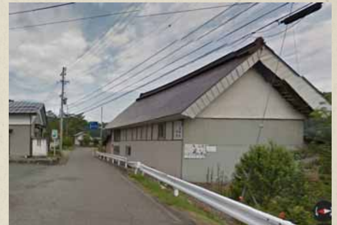
震災前画像