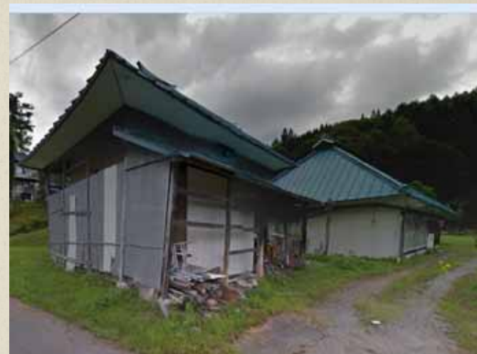
震災前画像