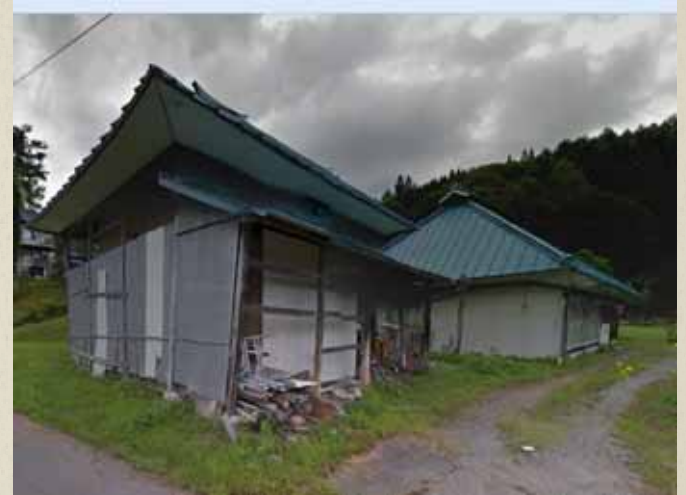
震災前画像