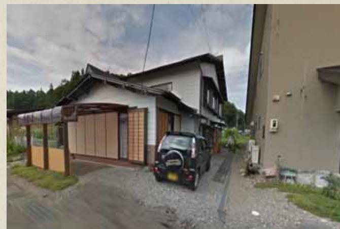
震災前画像