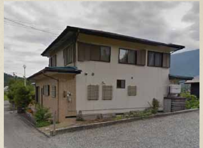
震災前画像