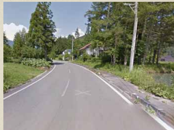
震災前画像