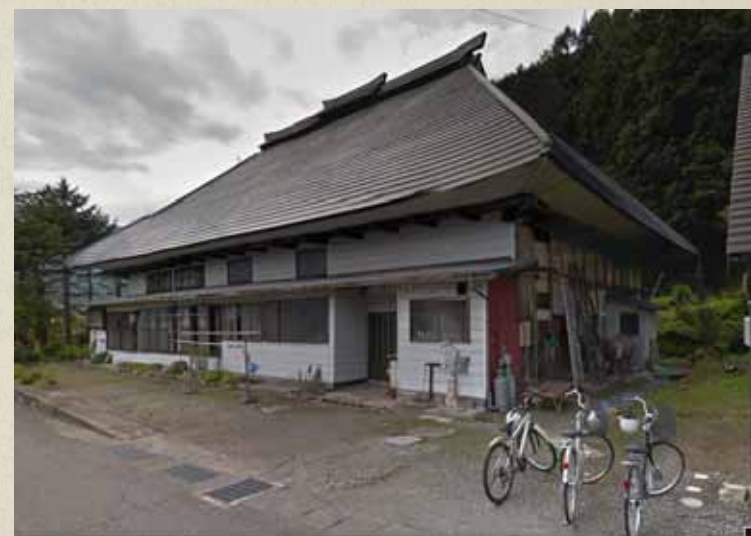
震災前画像