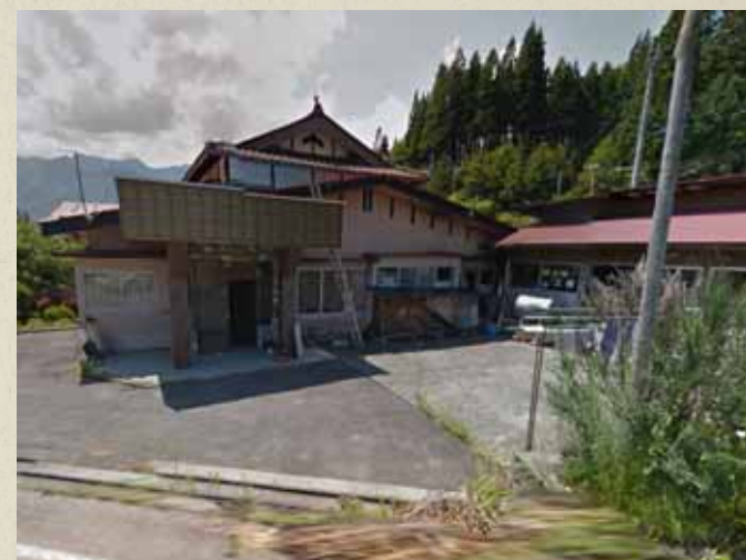
震災前画像 Googleストリートビューより抜粋