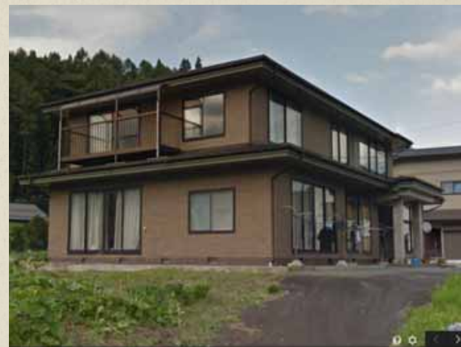
震災前画像