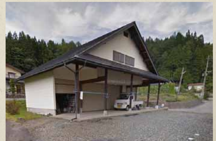
震災前画像