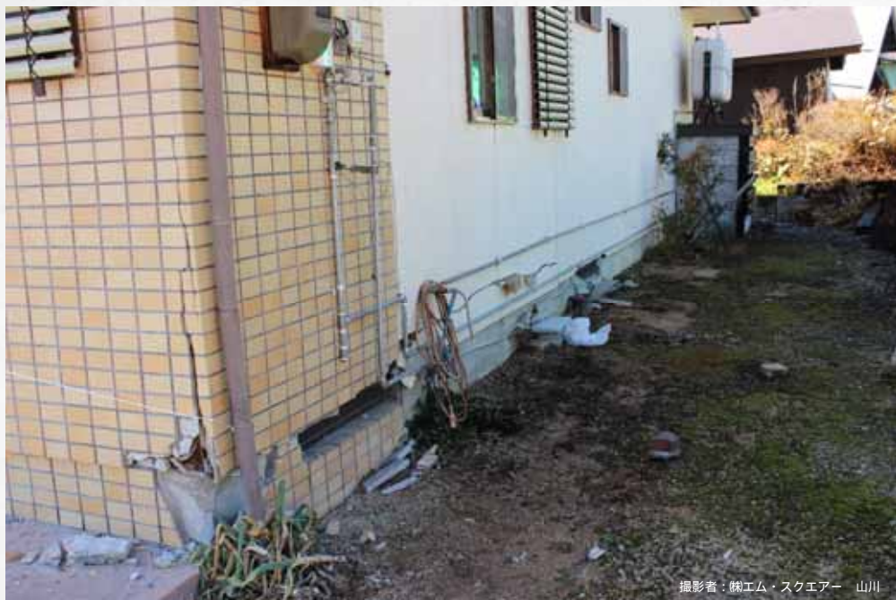
撮影者：㈱エム・スクエア 山川