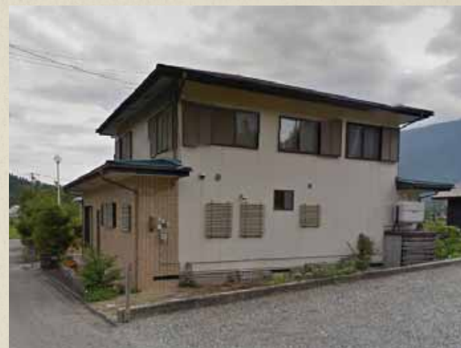
震災前画像 Googleストリートビューより抜粋