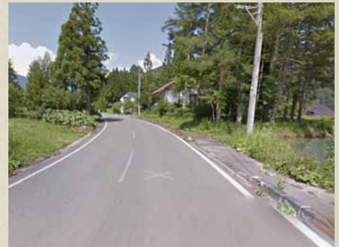
震災前画像