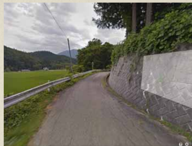
震災前画像