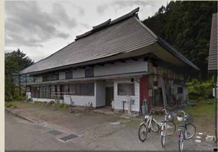
震災前画像