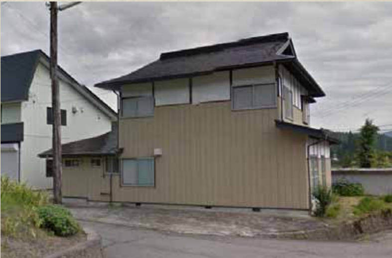
震災前画像